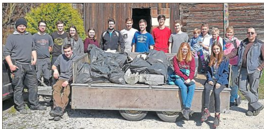
Rund 20 Freiwillige beteiligten sich an der Aktion „Ramadama“ und präsentierten einen Teil des gesammelten Unrats.